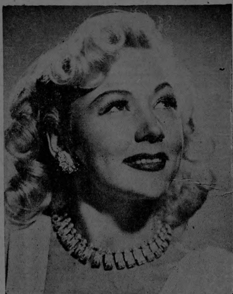
Max Factor Jr., el famoso experto de Hollywood, afirma que la belleza de la preciosa Gloria Graham, estrella de RKO-Radio, se complementa de modo excelente con un perfume de base floral.

Pero cuando se trata hoy de seleccionar un perfume, esta clasificación no es tan fácil de aplicar como el párrafo anterior parece