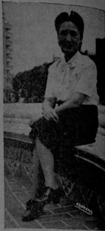
Señora de Chen

Saludamos al Excmo. Sr. Chenmu y su Señora, y por su medio, a la gran nación de China.